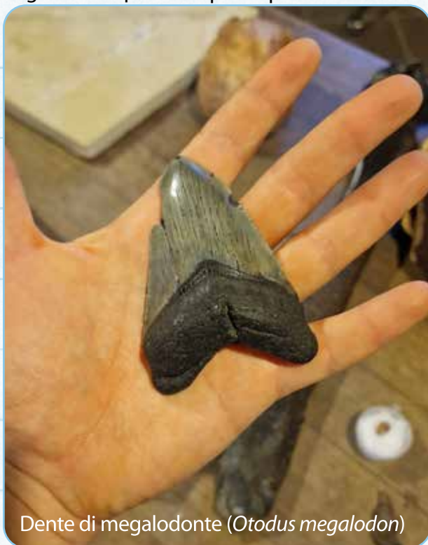
Dente di megalodonte ( Otodus megalodon )

Questo laboratorio pone particolare attenzione all'estinzione della Megafauna, avvenuta all'incirca tra i 50000 e i 10000 anni fa. Tanti animali popolavano i nostri territori e si sono estinti in un tempo relativamente breve, se comparato ai tassi di estinzione che si registravano prima di questo periodo.