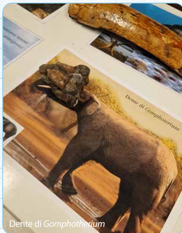
Dente di Gomphotherium

In un periodo storico che percorre il tardo Pleistocene fino all'Olocene, numerosi erano gli animali che popolavano il continente europeo. Si trovavano per esempio Mammuth lanosi ( Mammuthus primigenius ), Rinoceronti lanosi ( Coelodonta antiquitatis ), l'elefante dalle zanne dritte ( Palaeoloxodon antiquus ), l'alce irlandese ( Megaloceros giganteus ), il bisonte delle steppe ( Bison priscus ), l'orso delle caverne ( Ursus spelaeus ), il leone delle caverne ( Panthera spelaea ), l'uro ( Bos primigenius ), ma anche l'uomo di Neanderthal ( Homo neanderthalensis ). Comprendiamo quindi che la biodiversità animale vissuta in quel tempo era sensibilmente diversa rispetto a quella a cui siamo abituati ad immaginare, se la confrontiamo con quella dei giorni nostri.