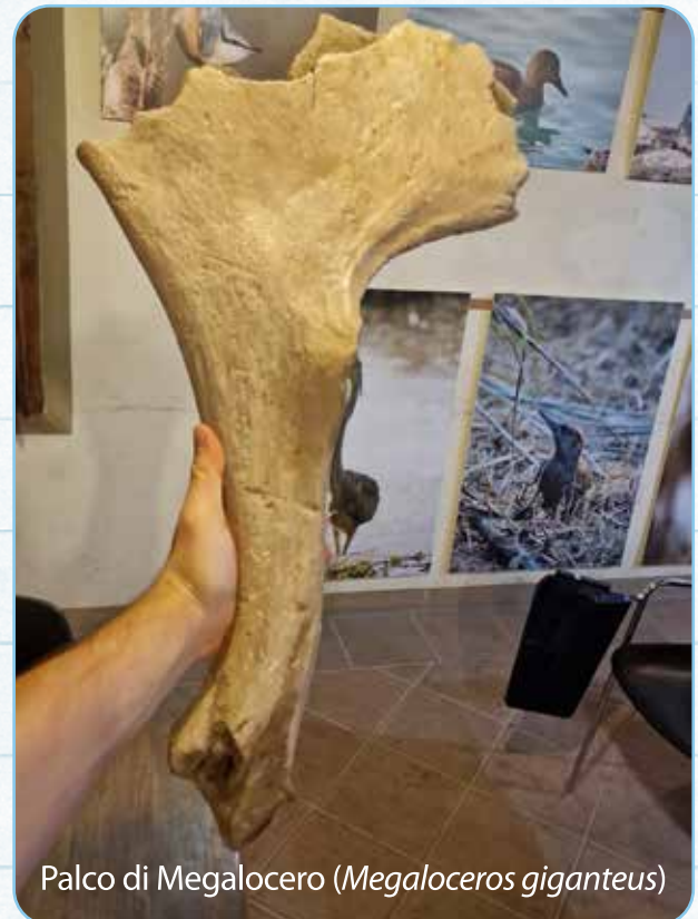
Palco di Megalocero ( Megaloceros giganteus )

Con questo termine ci riferiamo ad animali con una taglia che in genere supera i 40 kg da adulti. Rientrano in questa definizione per esempio animali ancora presenti come elefanti, ippopotami, giraffe, zebre, ma anche cavalli, asini, orsi, cervi, cinghiali e tanti altri. In questa definizione rientra per esempio anche la nostra specie, Homo sapiens .