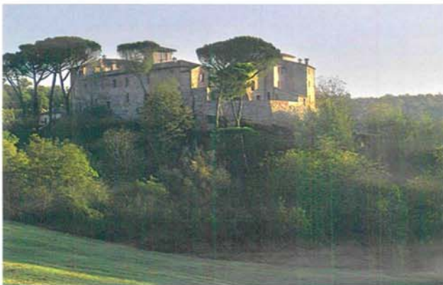
Castel Monastero è un borgo medievale trasformato in esclusivo resort

L'estate scorsa non sei riuscita ad andare al mare? Oppure adesso che arriva il brutto tempo ti è venuta un'irresistibile voglia di sole? La soluzione c'è e a un prezzo molto vantaggioso. Prenditi una vacanza a novembre. La meta possono essere le isole Canarie: non richiedono lunghi viaggi in aereo e il bel tempo è garantito. Ti consigliamo la selvaggia Lanzarote, "terra del fuoco" con paesaggi bellissimi e l'affascinante parco del Timanfaya, cuore vulcanico dell'isola. L'agenzia viaggi online Logitravel propone un soggiorno all'Arrecife Gran Hotel, un cinque stelle che si staglia sul parco, nei pressi di una baia molto bella. La struttura, alta e dall'inconfondibile stile architettonico, è diventata un simbolo di Lanzarote.