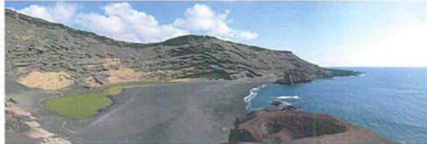
La spiaggia vulcanica di Lanzarote, nell'arcipelago delle Canarie