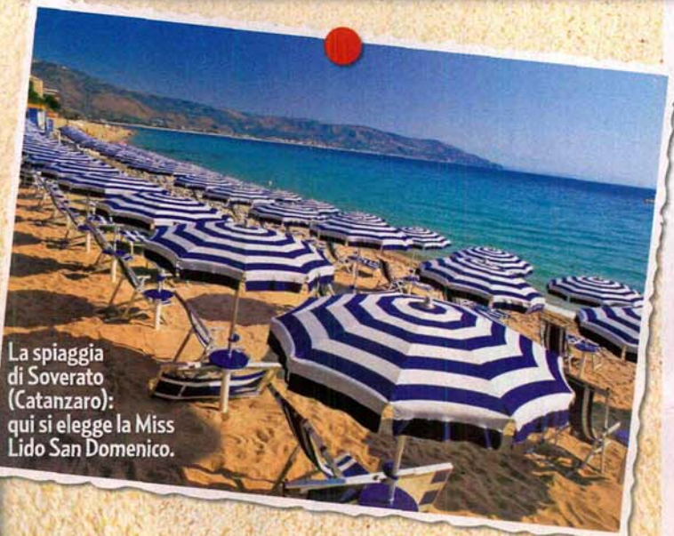
La spiaggia di Soverato (Catanzaro): qui si elegge la Miss Lido San Domenico.

IN CALABRIA DA 104 ANNI LA SUGGERIVA PROCESSIONE DELLA "MADONNA A MARE" Il 14 agosto si svolge la tradizionale Festa di Maria Santissima di Portosalvo di Soverato, in Calabria, detta "Madonna a mare" perché la statua viene portata dai marinai-pescatori sulle loro barche. La processione viene fatta in acqua e i bagnanti, al passare della Madonna, si tuffano in acqua in segno di devozione. Oltre alla processione, durante il fine settimana si svolgono la sagra del pesce sul lungomare, l'elezione di Miss San Domenico e, dal 13 al 16 agosto, a Soverato Superiore, la quinta edizione della Sagra di Mezza Estate con degustazione di piatti tipici calabresi. (Info: www.soveratoweb.it ).