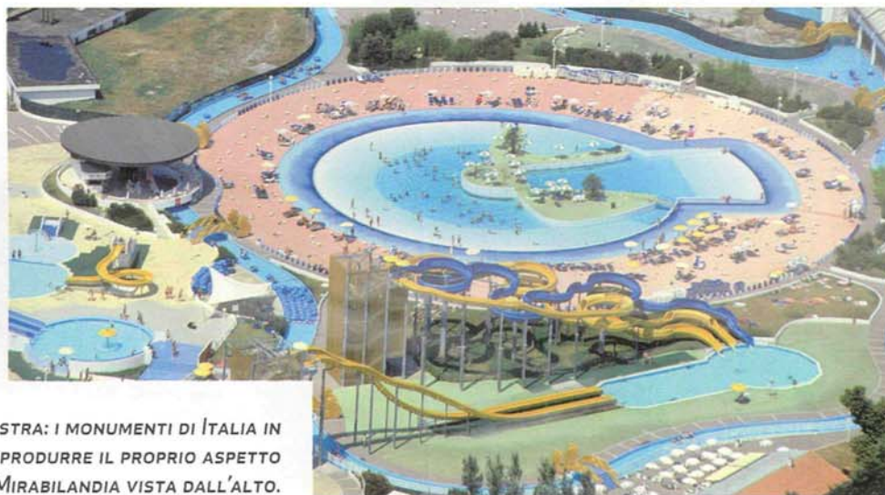
QUI SOPRA, DA SINISTRA: I MONUMENTI DI ITALIA IN MINIATURA, DOVE SI PUÒ RIPRODURRE IL PROPRIO ASPETTO TRIDIMENSIONALE; E MIRABILANDIA VISTA DALL'ALTO.